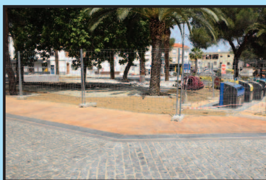
PLAZA DEL EMIGRANTE

Instalación de cámaras de videovigilancia en edificios públicos. Presupuesto de inversión 25.000 €. Próxima su instalación.