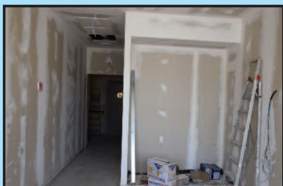
REFORMA EN PISOS TUTELADOS

Reforma en Pisos Tutelados para la creación de 8 plazas para dependientes. Presupuesto de inversión 194.000 €. Ejecutándose la obra actualmente.